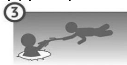
3 Не подползайте к краю близко, остановитесь в нескольких метрах от находящегося в воде человека. Тянетесь к нему палкой или бросьте веревку, пусть он попытается ухватиться

Призываем граждан полностью исключить возможность выхода на лед.