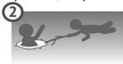
2 Возьмите длинную палку или веревку и осторожно ползите с ними к провалившемуся под лед человеку